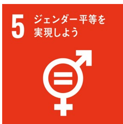
■持続可能な開発目標SDGs■